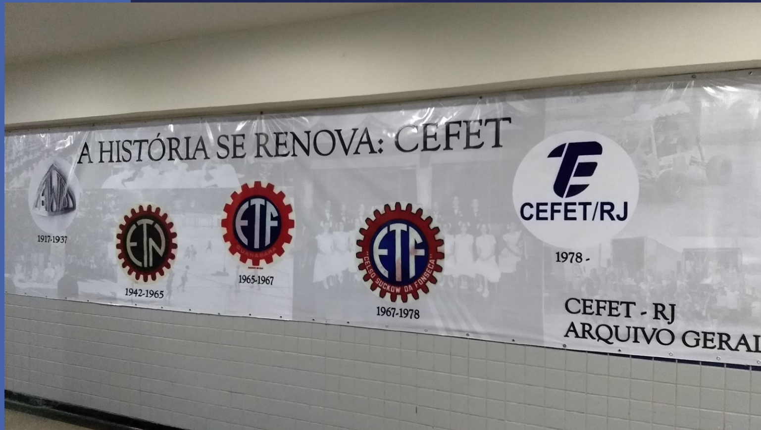
Banner com as diferentes nomenclaturas e períodos da escola.